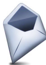
BUSTA PICCOLA DI COLORE BIANCO