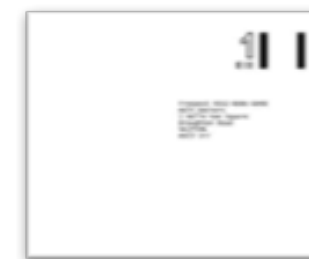
BUSTA PREAFFRANCATA per la restituzione al Consolato